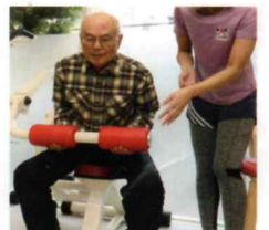
アブドミナルバック