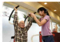
ショルダー・プレス